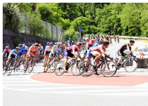
急カーブの通称「T O」コーナー