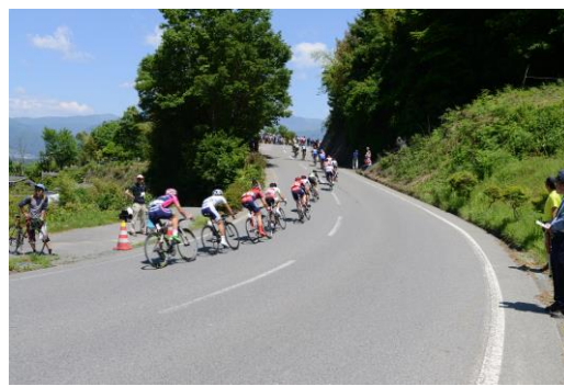
アップダウンの激しいコース