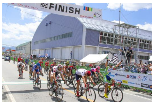
デッドヒートを制する