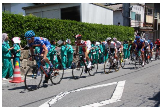
沿道の声援を受けて