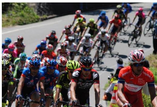
周回コースでの熱戦