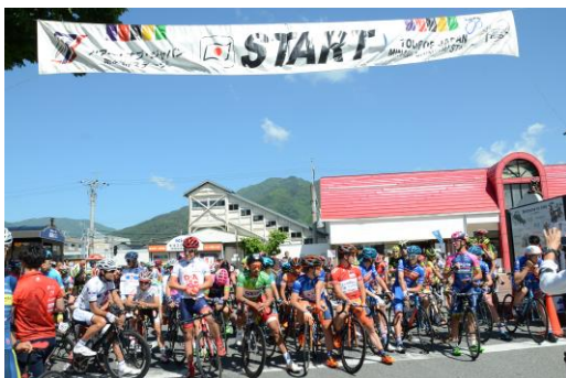
スタート地点の飯田駅前

レースの実施に併せて、飯田市長を始め市民・自転車競技ファンによる「パレード走行」、コース上に選手への応援メッセージを書く「チョークイベント」、また地元保育園児、小・中学生を対象に授業の一環として観戦の呼びかけを実施するなどし、地元住民や自転車競技ファンがより身近に自転車競技および自転車の魅力に触れられる機会を提供した。また、レースの模様を地元ケーブルテレビや地元FMラジオ、USTREAMにて中継放送を行うなど、情報発信に努めた。