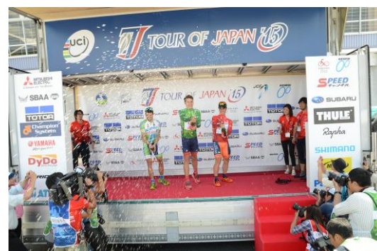
表彰式でのシールドファイト