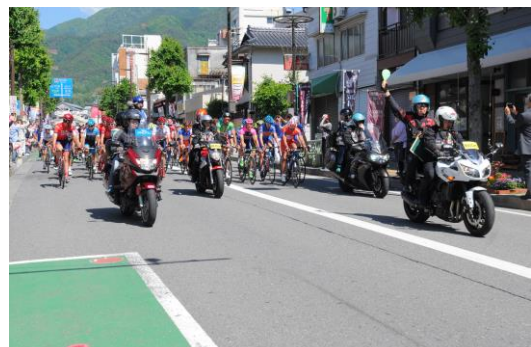
飯田駅前からのパレード走行